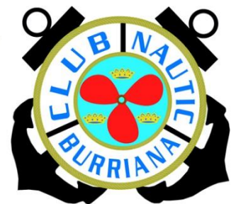
CLUB NÁUTICO BURRIANA