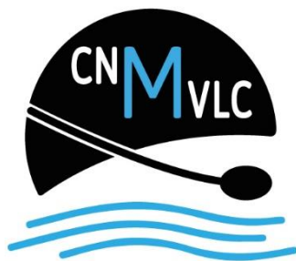
CLUB NATACIÓN MEDITERRÁNEO VLC