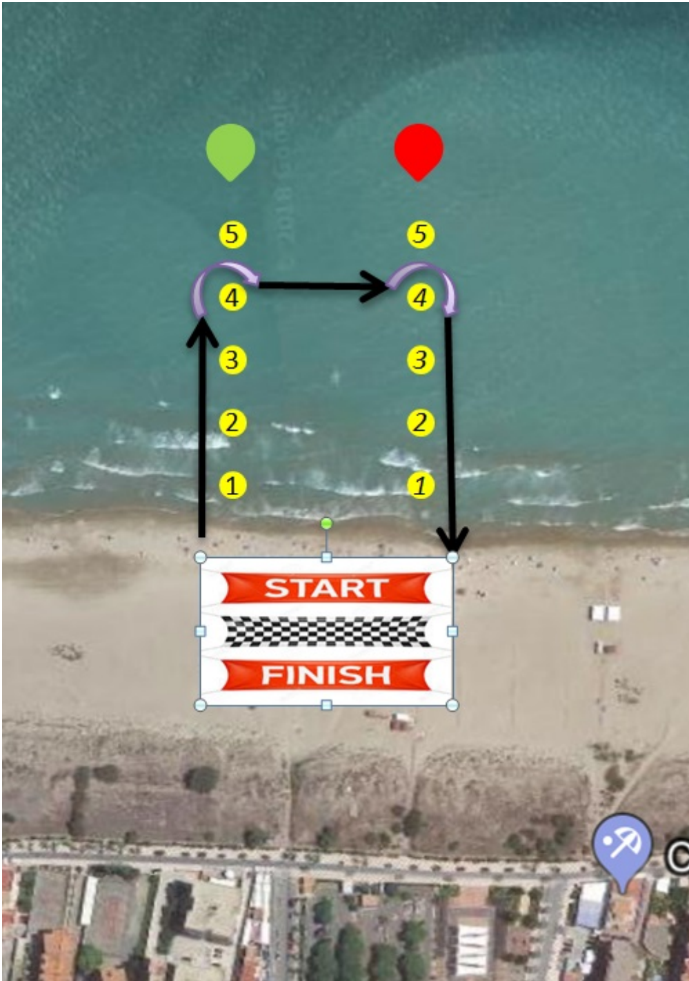
TRAVESIA MENORES (PODRAN IR ACOMPAÑADOS)