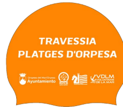
TPO 2.000m (Federados FNCV)